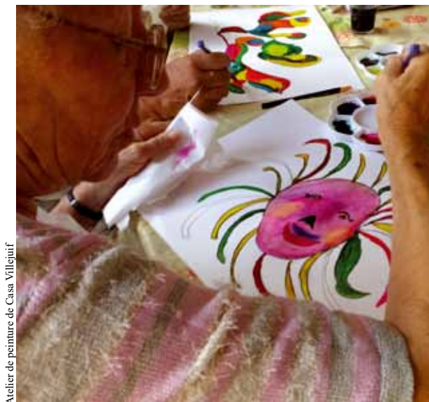
Atelier de peinture de Casa Villejuif

Tous ces thèmes illustrent la formation qui leur est proposée. Ce programme psycho-éducatif comprend trois dimensions :